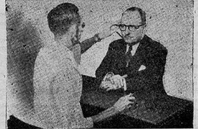
PREPARACION DE RECETAS DE OCULISTAS